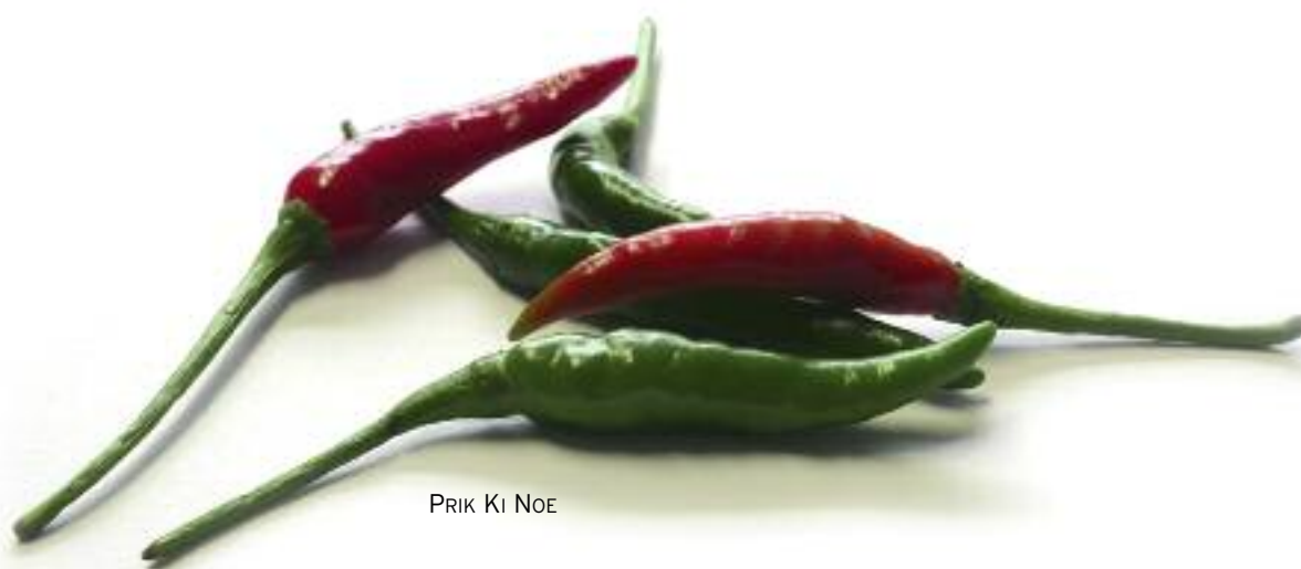
PRIK KI NOE