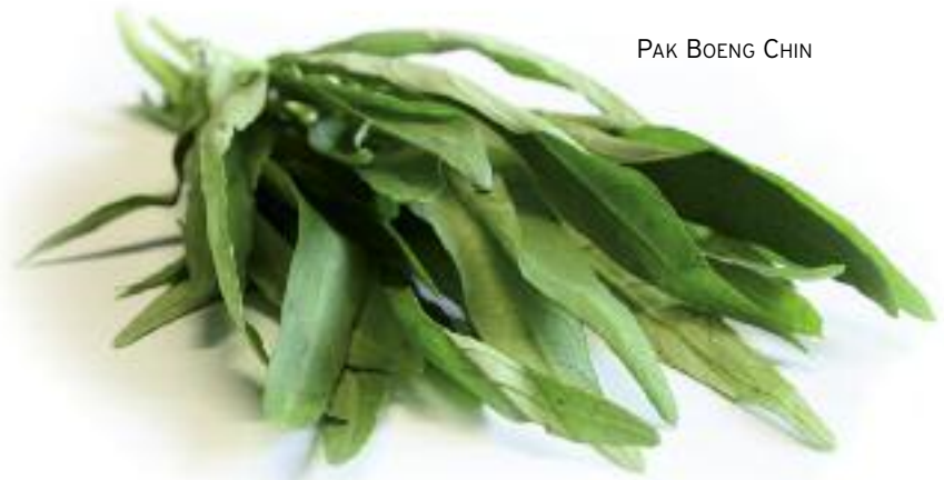
PAK BOENG CHIN

Chateau La Jaubertie "Bergerac sec" wit/blanc Of Château du Prieuré des Mourgues «St.-Chinian» rood / rouge