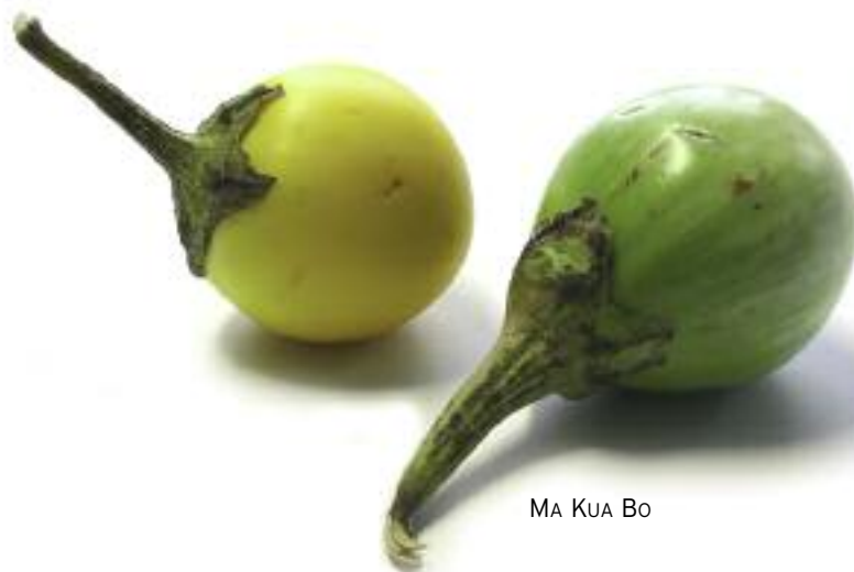
MA KUA BO