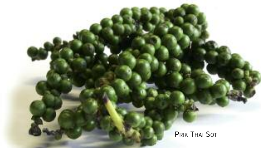
PRIK THAI SOT