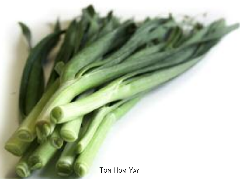
TON HOM YAY