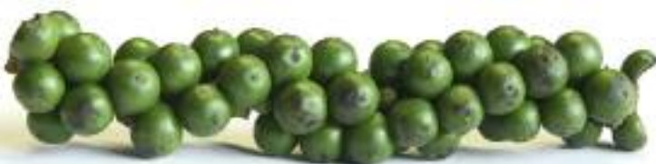
PRIK THAI SOT