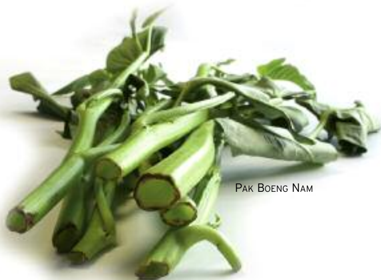
PAK BOENG NAM