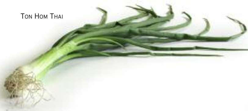
TON HOM THAI